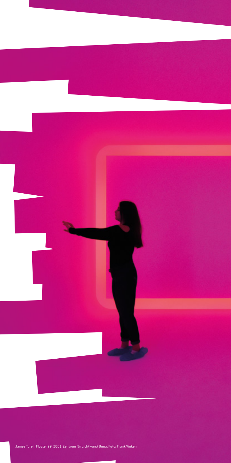
James Turrell, Floater 99, 2001, Zentrum für Lichtkunst Unna, Foto: Frank Vinken